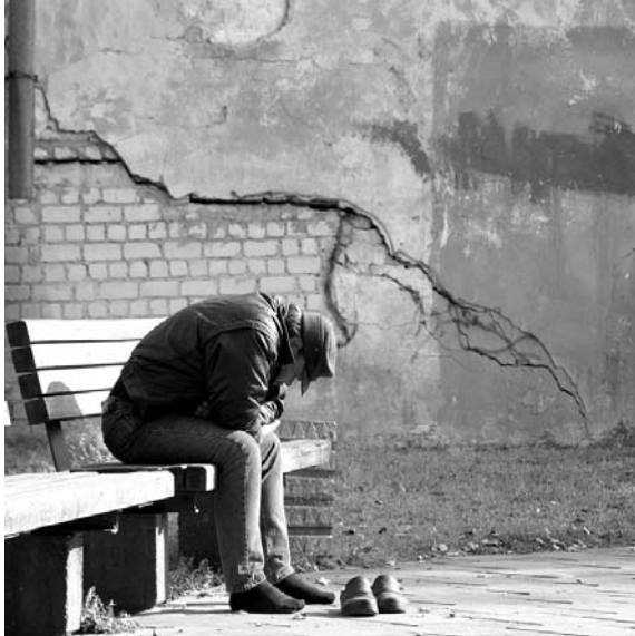
Žmogų į žalingus įpročius dažnai pastūmėja nerimas, depresija, didelė įtampa ar liūdesys.