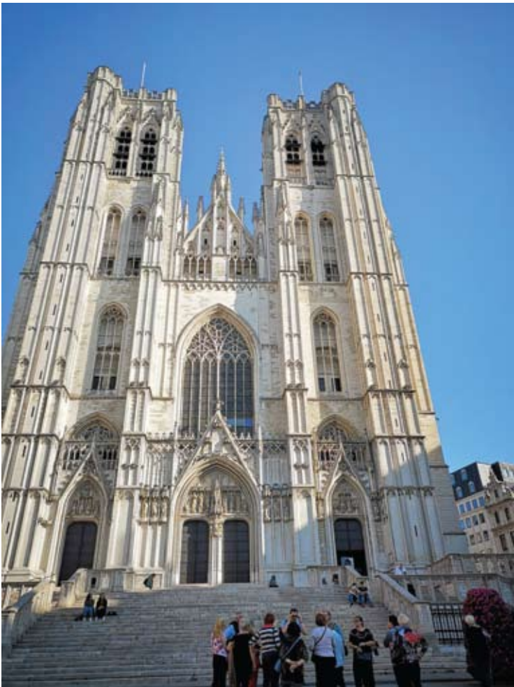
Bruselio katedra, statyta tris šimtus metų. Statybos pradėtos dar XIII amžiuje.