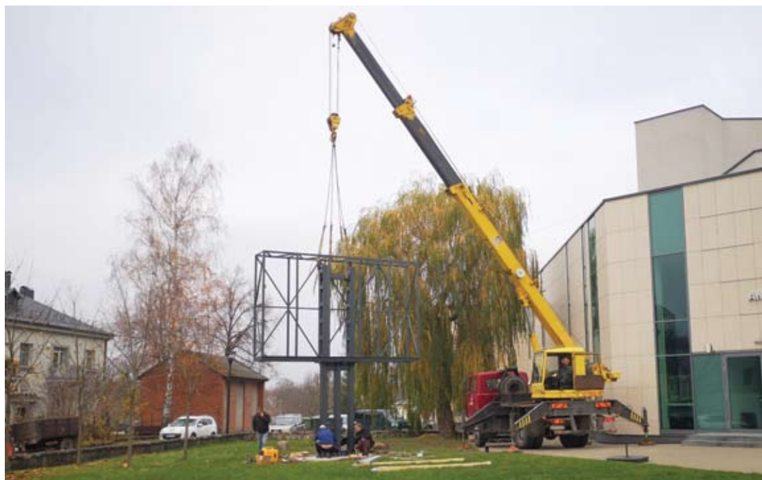
LED lauko ekranas bus gana didelis - 4,8 x 2,8 metro, todėl jo konstrukcijoms pastatyti buvo pasitelktas kranas.

Šio ekrano įrengimas Anykščių rajono savivaldybės biudžetui kainuoja 46 tūkstančius 657 Eur. Už tokią sumą Anykščiuose galima nupirkti du butus.