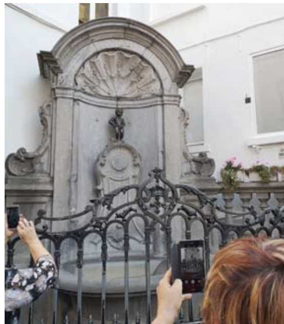
Sisiojantys Bruselio vaikai...