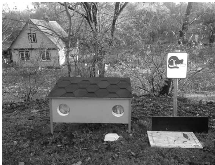
Bešeimininkės katės nuo lietaus ir vėjo galės slėptis tokiuose nameliuose.